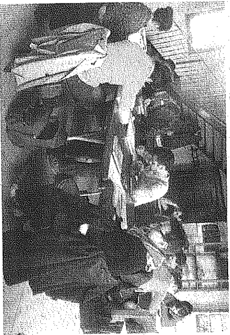
Alcuni studenti del liceo scientifico Olivelli in aula

Situato in viale della Libertà, il liceo scientifico Olivelli ospita un'ottantina di studenti a cui vengono offerte varie attività extracurricolari importanti per la loro formazione. «Riserviamo grande attenzione alla qualità dell'insegnamento e alla preparazione degli studenti, nonché alla loro crescita. Cerchiamo di essere presenti accompagnandoli nel loro cammino formativo e rimanendo sempre disponibili a sostenere ed aiutarli nei momenti di necessità» sostiene il dirigente Fabrizio Gasperoni. «Di notevole importanza - aggiunge - anche il rapporto con le famiglie, che devono essere sempre informate e coinvolte». Gli studenti possono frequentare corsi di preparazione alla certificazione linguistica, al patentino Ecdl (patente europea del computer), corsi di informatica e di pittura e molto altro. «Stiamo preparando - continua Gasperoni - un lavoro di approfondimento su materiale originale della prima guerra mondiale per una mostra che si terrà indicativamente a fine febbraio per gli studenti di terza media» ed è, inoltre, in corso un ciclo di otto incontri,